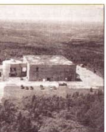
Une infime partie des installations de la base Saint-Sylvestre digne des meilleurs films d'Hollywood.

que la base ten erait les bâti lait à un dém ionnel avec di rtant des effe , mais étrange