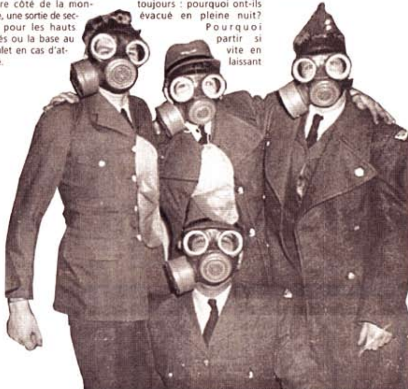
Les soldats de l'époque en tenue antinucléaire.

Aujourd'hui encore, malgré le fait que le Mont Radar de Saint-Sylvestre soit devenu un lieu touristique, une aura de mystère flotte sur ces lieux et toute personne qui s'y rend ne peut s'empêcher de s'interroger sur les sort étrange de ce lieu au destin marqué par une mystérieuse inconscience.