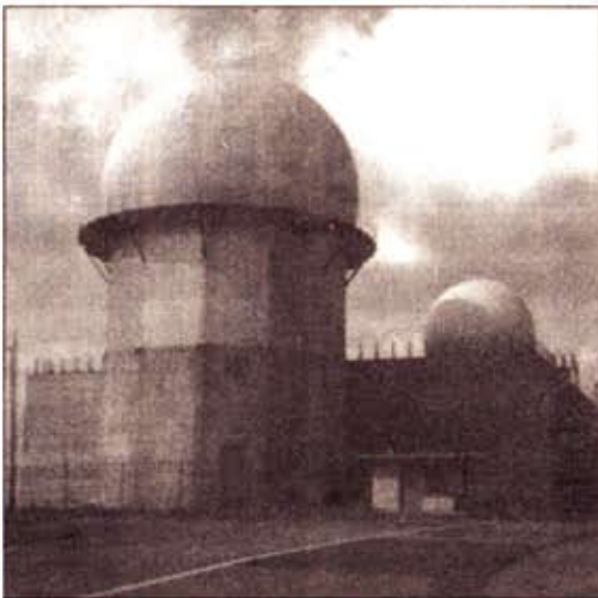
Que s'est-il passé en cette fatidique nuit?

quelque chose les Ont-ils eu peur o nucléaire? Et pen les soviétiques at sont-ils enfuis? Et les chercher comm