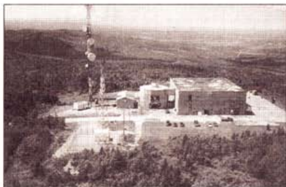
Une infime partie des installations de la base Saint-Sylvestre digne des meilleurs films d'Hollywood.